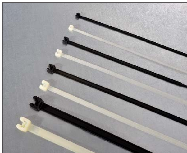
Det mest iøynefallende er det åpne låsehodet.

For detaljert informasjon om monteringsverktøy, se side 15.